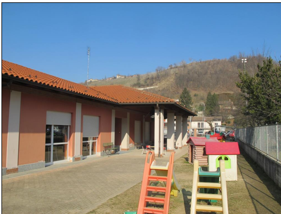
Foto 2 - Vista della Scuola

L'edificio preso in esame è di seguito rappresentato: