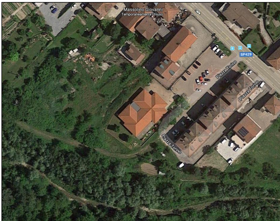
Foto 1 - Localizzazione della Scuola dell'Infanzia

L'edificio ospitante la Scuola dell'Infanzia di Frazione Ricca di Diano d'Alba, è posizionato in zona centrale della Frazione, su Piazza Torino.