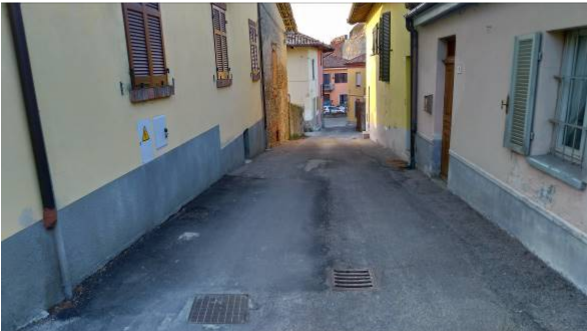
- Fotografia n. 4: Vista di un tratto di via Vittorio Emanuele