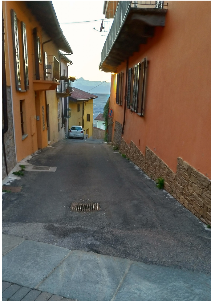
- Fotografia n. 5: Tratto finale di via Regina Margherita I