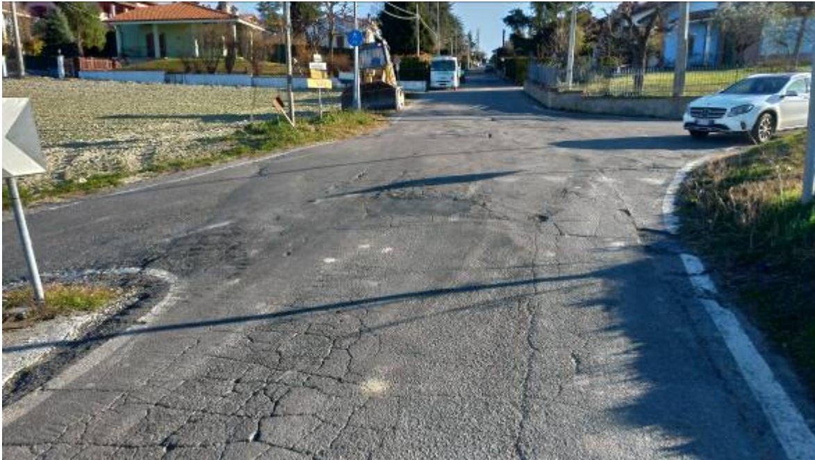
- Fotografia n. 1: Vista dell'incrocio tra via San Sebastiano e via Pittatori;