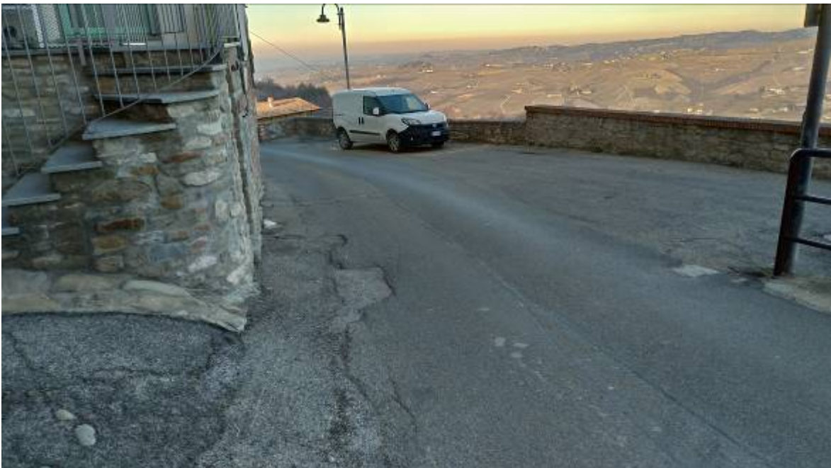
- Fotografia n. 2: Vista di via Umberto I;