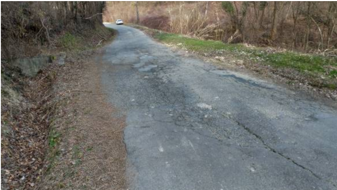
- Fotografia n. 10: Vista porzione del tratto 4 di Via Parisio (Bolichino)