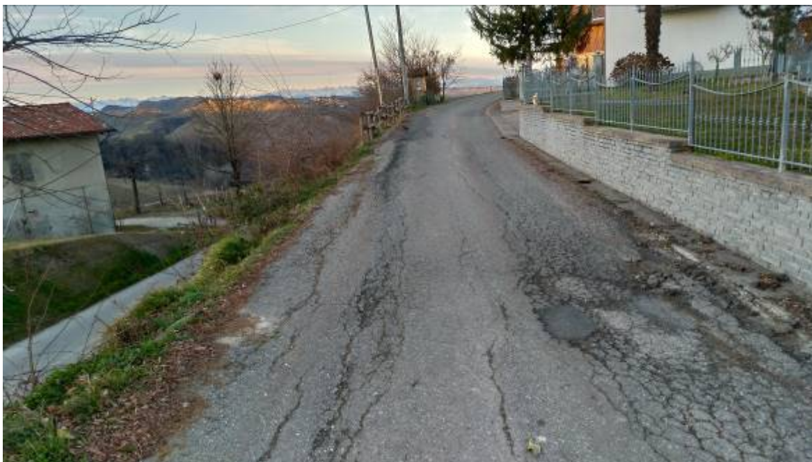
- Fotografia n. 11: Vista porzione di strada Santa Croce