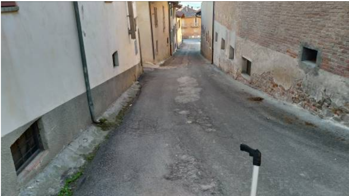
- Fotografia n. 6: Tratto di via Regina Margherita II