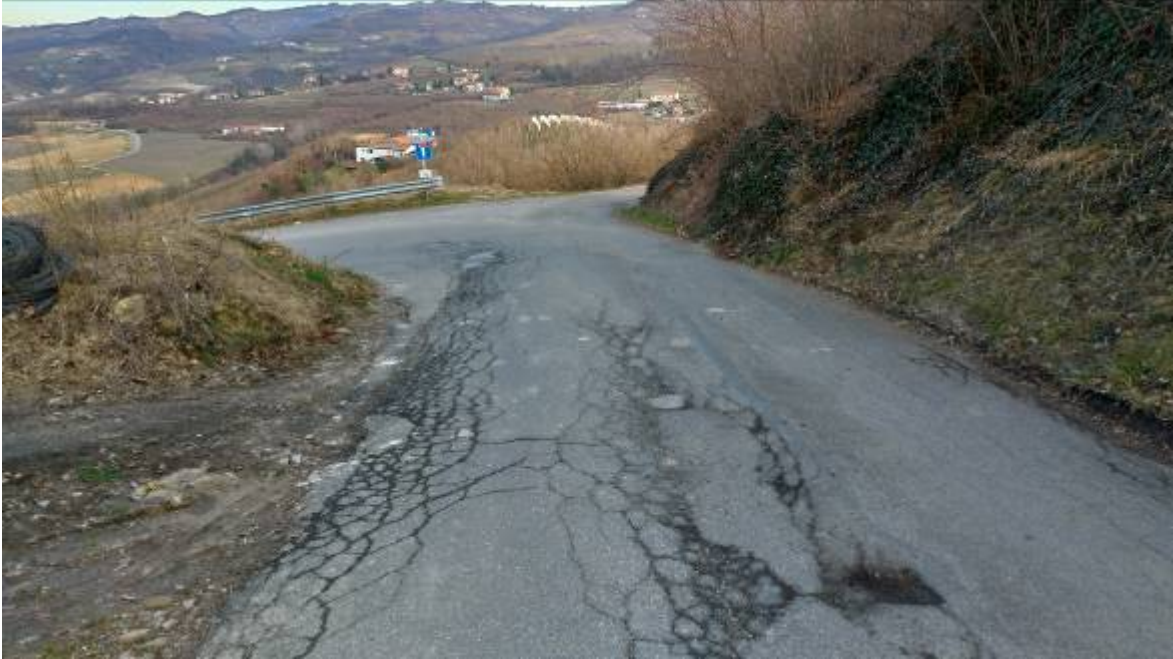
- Fotografia n. 9: Vista di un tratto di via Parisio I