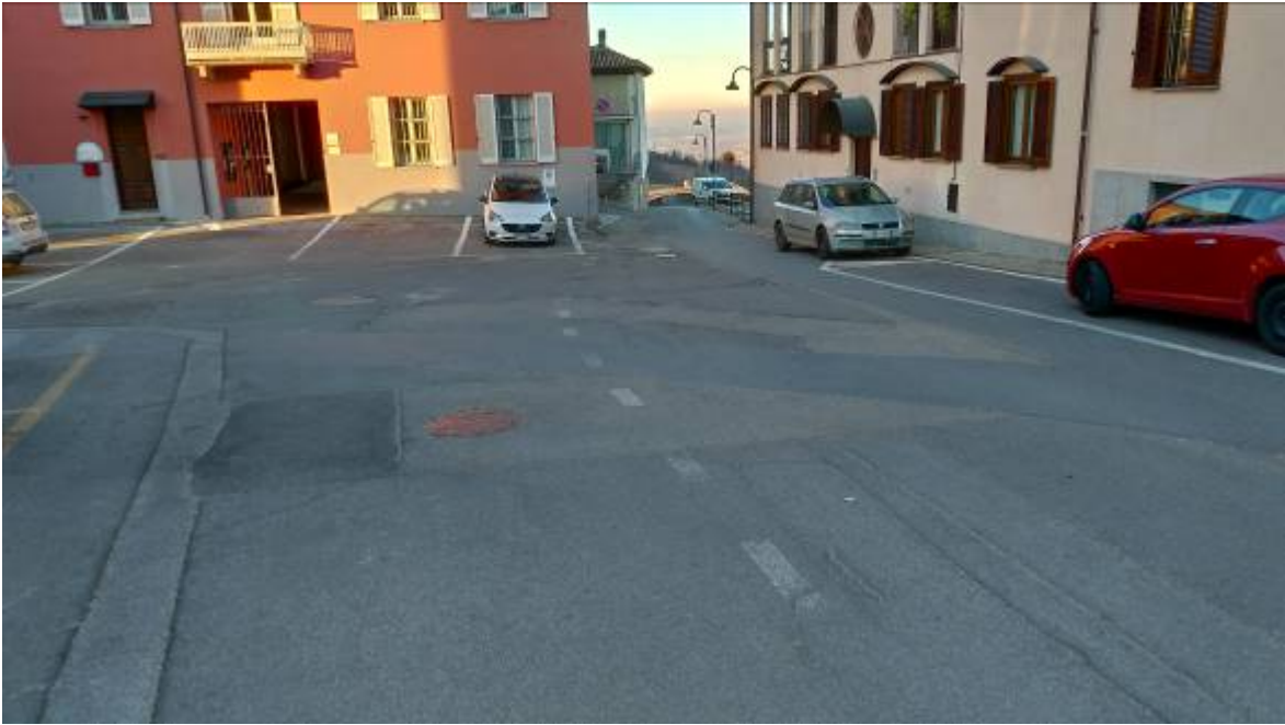
- Fotografia n. 3: Vista della strada e del piazzale antistante le scuole;