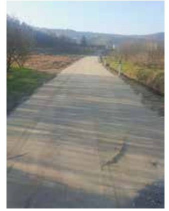
Consolidamento tratto di via Conforso