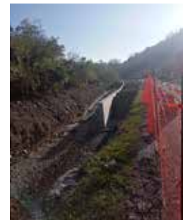
Un muro di sostegno della strada in via Parisio