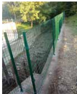
Nuova rete di sicurezza amovibile in rio di Valle T