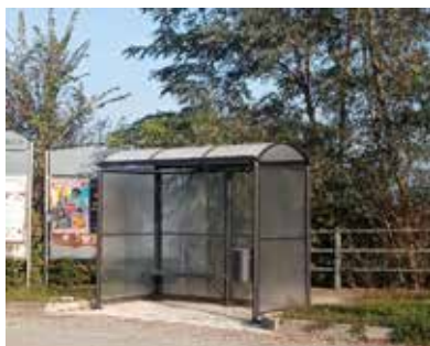
Nuova pensilina utilizzabile da tutti ma ancor più dagli ospiti della comunità L'Accoglienza