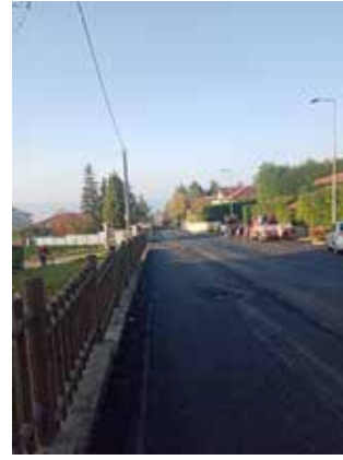
Riasfaltatura tratto di via san Sebastiano e via Tarditi