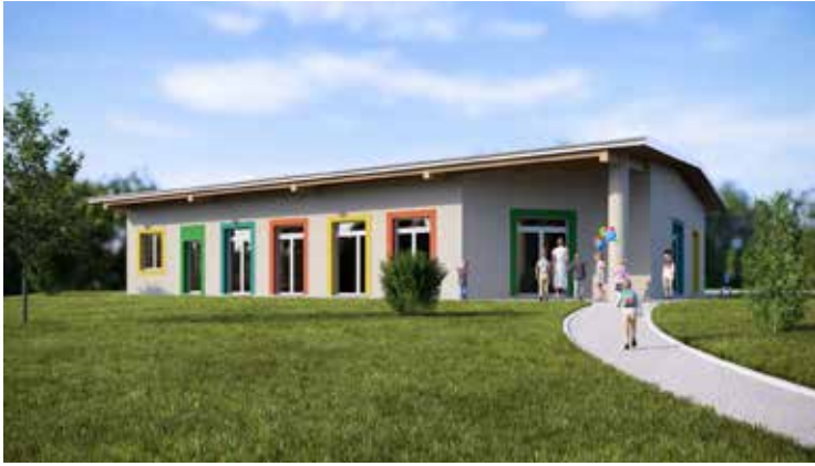
Asilo nido in fraz Ricca (inizio lavori entro il 31/01/2025)