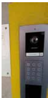
Nuova citofonia per le scuole

"Pulizia di un tratto del torrente Cherasca in collaborazione con il COM2 della Protezione Civile e il Comune di Rodello. Un modo concreto per ricordare la tragica alluvione del 1994 che colpì duramente anche la nostra comunità"