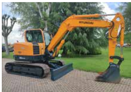
Acquisto scavatore munito anche con trincia Forestale unitamente a prot Civile Rodello, Comuni di Rodello e La Morra