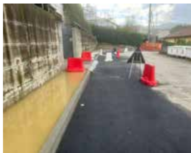
Lavori di urbanizzazione nel pec 17