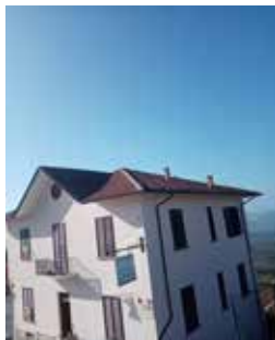
Riqualificazione ex caserma dei Carabinieri