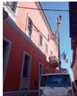
Ritinteggiatura palazzo municipale