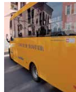
Secondo scuolabus nuovo negli ultimi due anni