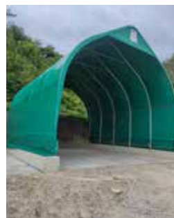
Nuovo capannone per la custodia del sale stradale