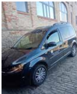
Nuovo veicolo 4x4 per Prot Civile e dipendenti comunali