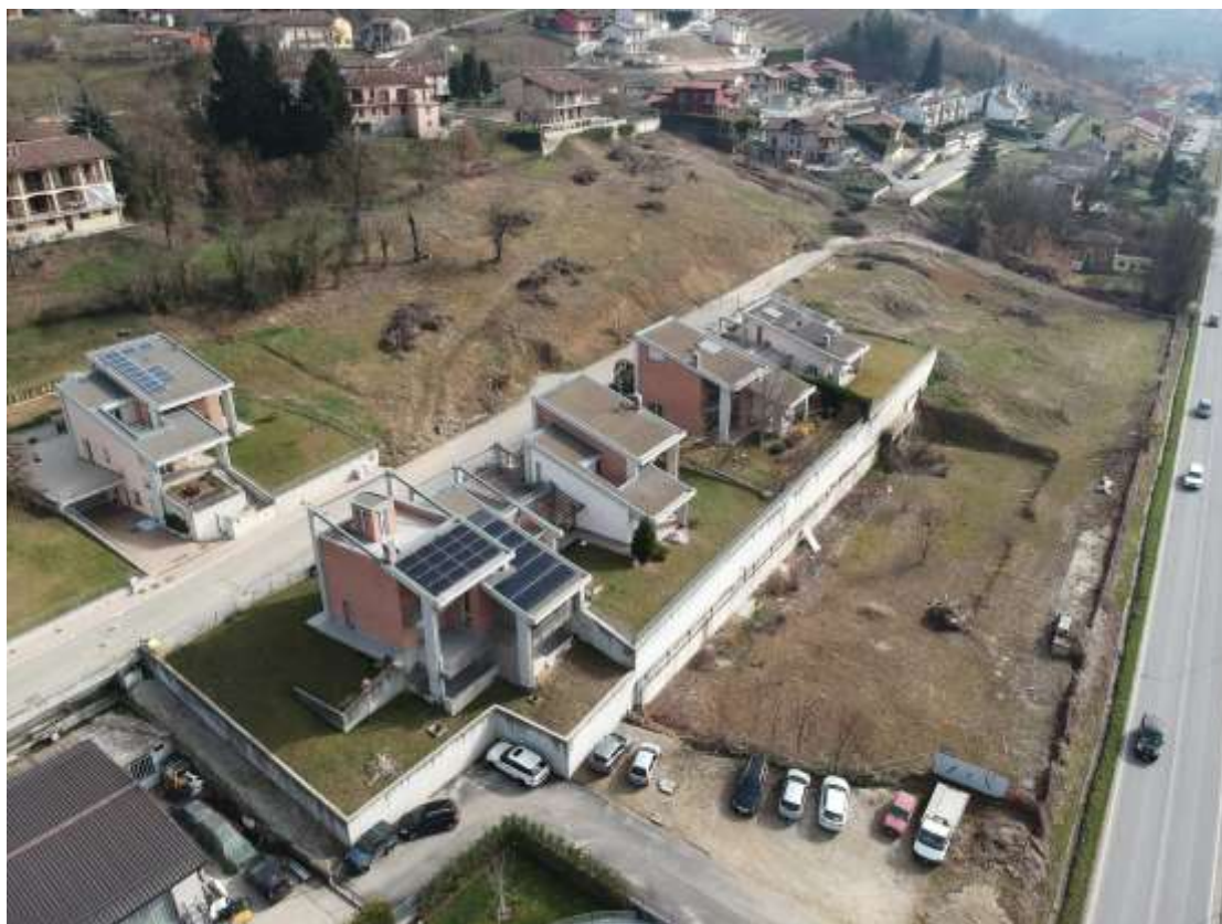
FOTOGRAFIA 2: VISTA GLOBALE del terreno di P.E.C. verso ovest