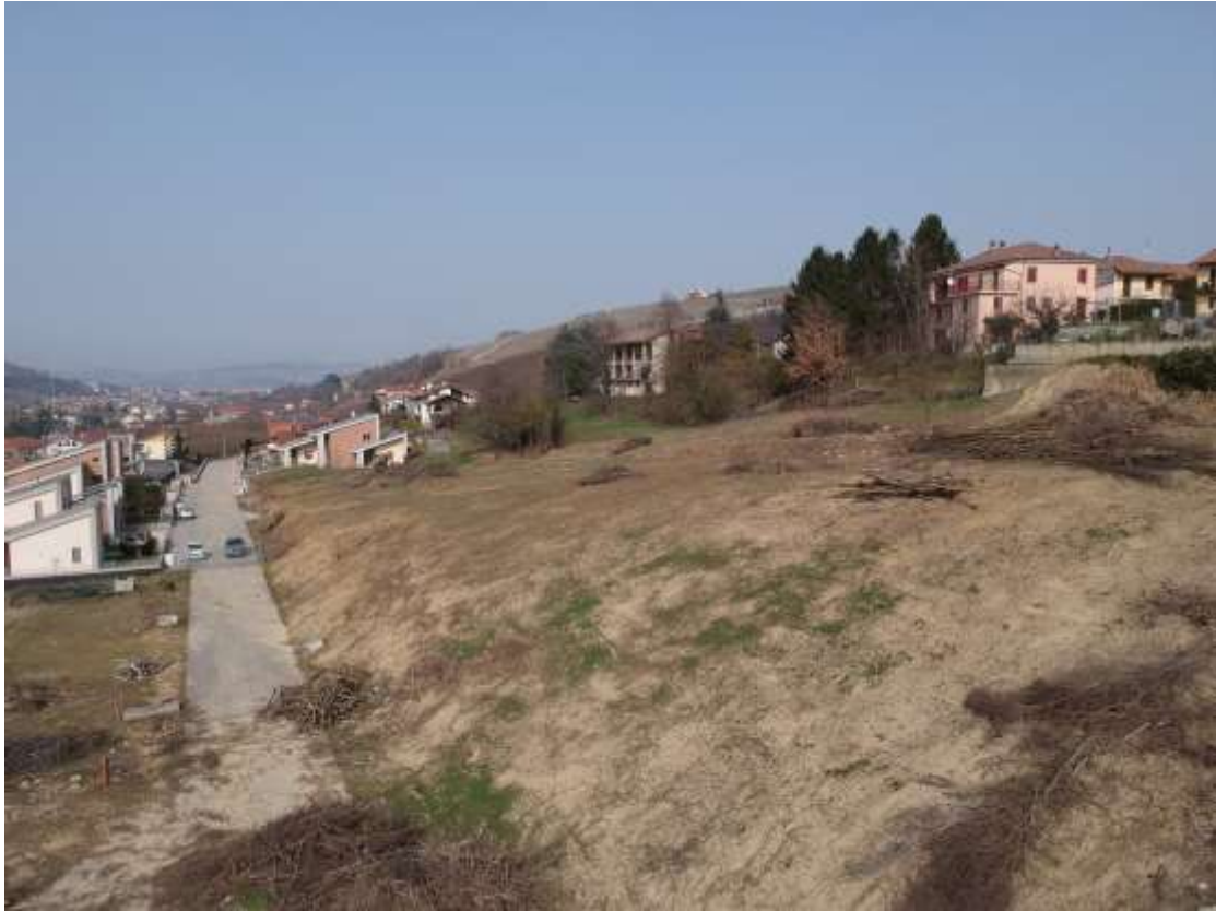
FOTOGRAFIA 6: VISTA della ZONA a VALLE della STRADA DI P.E.C.