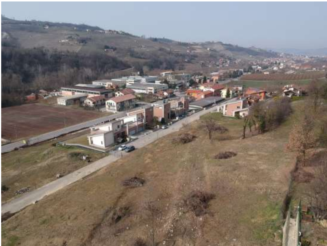
FOTOGRAFIA 4: VISTA GLOBALE del terreno di P.E.C. verso est